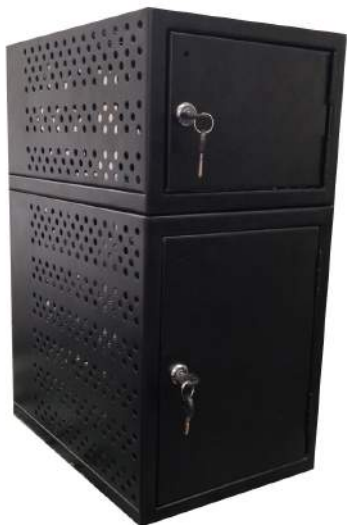
Caja de seguridad