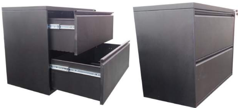
Almacenamiento de carpetas tamaño carta y oficio