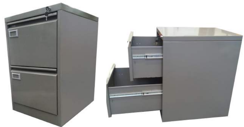
Almacenamiento de carpetas tamaño oficio.